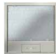
Tamaño nominal 9 con asa, acero inoxidable. 264x264 mm. 12 Mecanismos Modul 45.