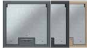
Tamaño nominal 4 con asa, poliamida. 222x222 mm. 6 Mecanismos Modul 45.