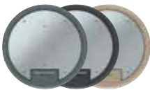
Tamaño nominal R4 con asa, poliamida. Ø 234 mm. 6 Mecanismos Modul 45.