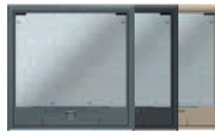
Tamaño nominal 9 con asa, poliamida. 264x264 mm. 12 Mecanismos Modul 45.