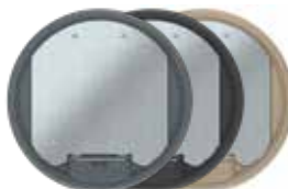
Tamaño nominal R9 con asa, poliamida. Ø 324 mm. 12 Mecanismos Modul 45.