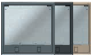
Tamaño nominal 9 con cierre deslizante poliamida. 264x264 mm. 12 Mecanismos Modul 45.