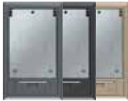
Tamaño nominal 2 con asa, poliamida. 118x194 mm. 3 Mecanismos Modul 45