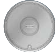
Tamaño nominal R9, aluminio. Ø 325 mm. 12 Mecanismos Modul 45.