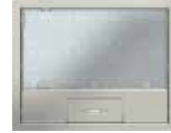
Tamaño nominal 6 con asa, acero inoxidable. 222x222 mm. 6 Mecanismos Modul 45.