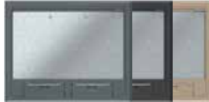
Tamaño nominal 6 con asa, poliamida. 274x221 mm. 9 Mecanismos Modul 45.