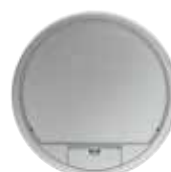
Tamaño nominal R9 con asa, aluminio. Ø 323 mm. 12 Mecanismos Modul 45.