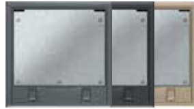
Tamaño nominal 4 con cierre deslizante, poliamida. 222x222 mm. 6 Mecanismos Modul 45.