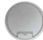
Tamaño nominal R7 con asa, aluminio. Ø 294 mm. 10 Mecanismos Modul 45.