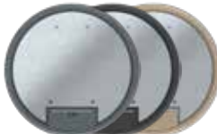
Tamaño nominal R7 con asa, poliamida. Ø 294 mm. 10 Mecanismos Modul 45.