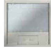
Tamaño nominal 4 con asa, acero inoxidable. 222x222 mm. 6 Mecanismos Modul 45.