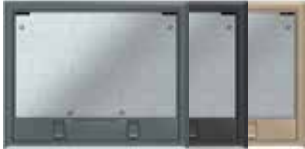
Tamaño nominal 6 con cierre deslizante poliamida. 274x221 mm. 9 Mecanismos Modul 45.