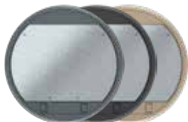
Tamaño nominal R9 con cierre deslizante, poliamida. Ø 324 mm. 12 Mecanismos Modul 45.